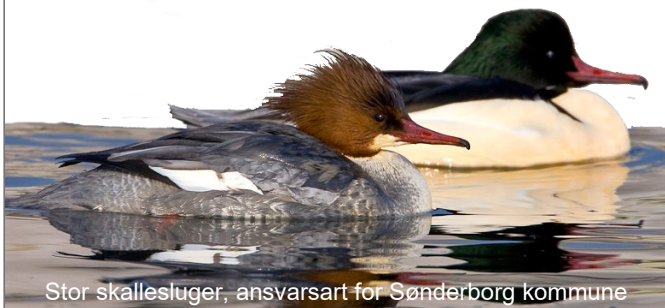
Stor skallesluger, ansvarsart for Sønderborg kommune

* Ikke-medlemmer kan se ændringer på www.oasweb.dk