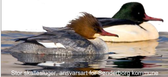
Stor skallesluger, ansvarsart for Sønderborg kommune

N.B.: Turene er gratis. Du behøver ikke at være medlem af foreningen, for at deltage på vores guidede ture.