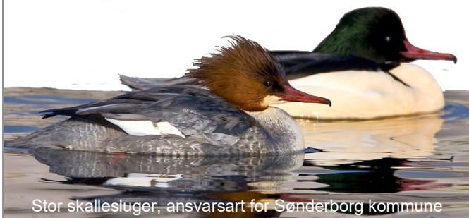
Stor skallesluger, ansvarsart for Sønderborg kommune

* Ikke-medlemmer kan se ændringer på www.oasweb.dk