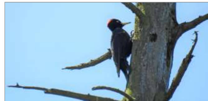
Sortspætte