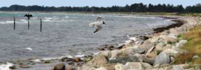
Layout og tryk: Viggo Petersen - 51351373

Onsdag d. 15. maj kl.10.00 til 12.00 Vi ser på stedets havfugle, sangere og andre småfugle. Chance for rødrygget tornskade og gul vipstjert. Mødested: P-pladsen ved Pøls Rev. Kør gennem Neder-Lysabild og drej til højre ved Felsgaard. Turleder: Svend Ove Jensen. Tlf. 21 60 02 56