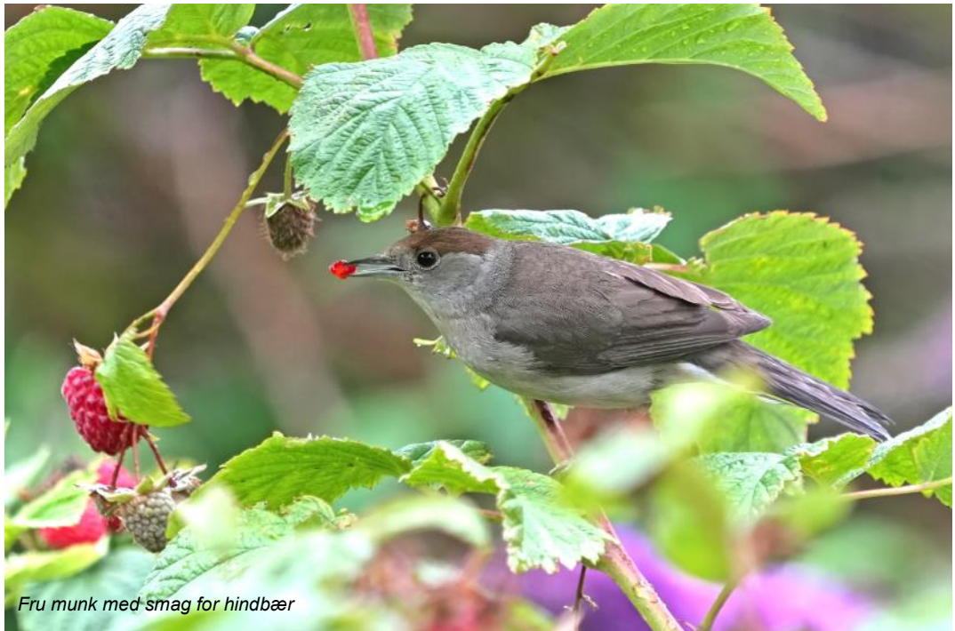
Fru munk med smag for hindbær

Hvis I, kære læsere, har set andre fugle spise bær i haven, så må I meget gerne fortælle om det. Helst her i Panurus , naturligvis.