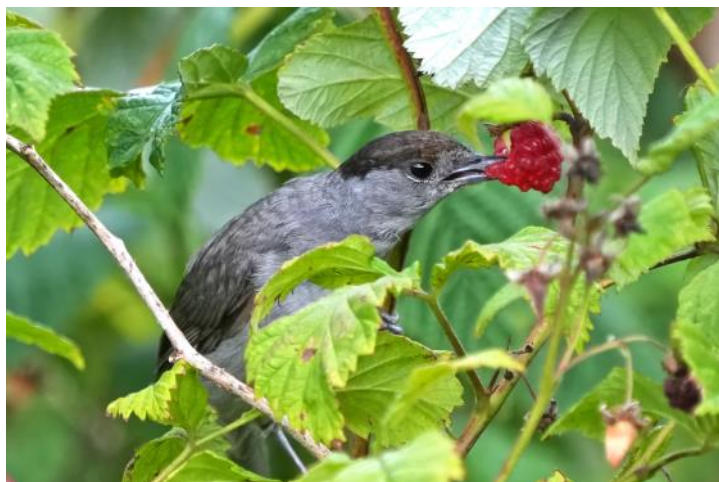
Hr munk på hindbærrov

Solbær og brombær. Disse røres næsten ikke af fugle. Vi har kun en enkelt gang observeret en Solsort spise modne bær i et hegn af vilde brombær, men det er flere år siden. Brombær må have været til stede i naturen i rigtig mange år, så det er lidt underligt, hvis ingen fugle har fået smag på bærrerne.