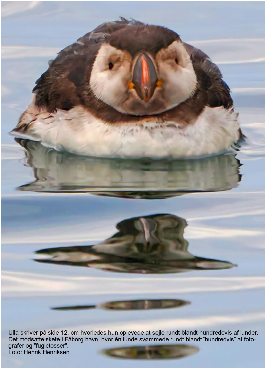
Ulla skriver på side 12, om hvorledes hun oplevede at sejle rundt blandt hundredevis af lunder. Det modsatte skete i Fåborg havn, hvor én lunde svømmede rundt blandt "hundredevis" af fotografer og "fugletosser".