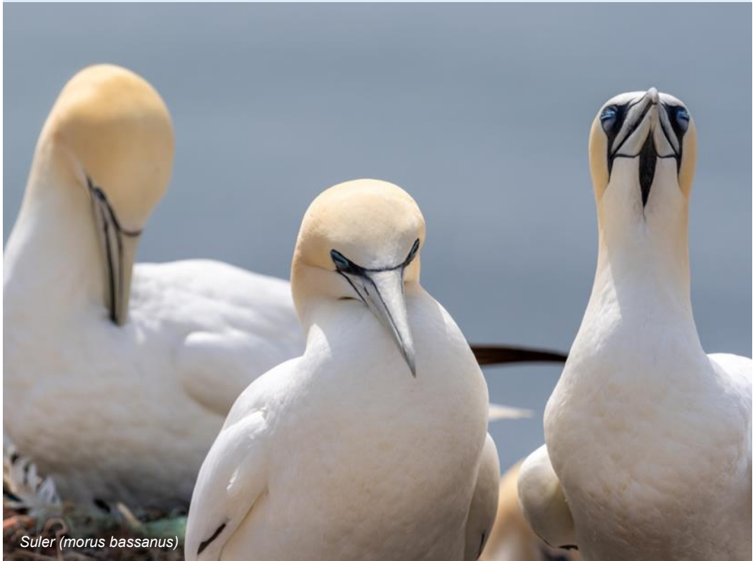
Suler (morus bassanus)

markant større end de andre 2 arter, og dermed sagtens kan dominere dem. Men det virker dog som om arterne har forskel-