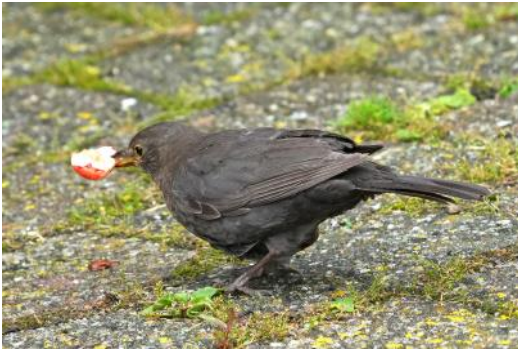
Solsort på terrassen med et kirsebær

D et vil nok være de fleste bekendt, at en flok Stære kan rydde et kirsebærtræ for frugter på få dage, og at Solsorten er glad for jordbær. Men der er flere andre fuglearter, der nyder godt af bærrerne i vores haver, hvis de får chancen. Her er en lille liste over bær og fugle, som vi har iagttaget og fotograferet her i sommer.