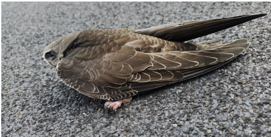
Nødlandet mursejlerunge

fuglene (den nederste) som prøvede og prøvede forgæves at komme ud af kassen – selv hver morgen lå den der stadig. Så begyndt jo mine overvejelser: er den syg eller har den opgivet at komme ud – overladt i en stærekasse til sultedøden uden at kunne komme ud. Jeg besluttede at gøre noget, så jeg tog kassen ned og tog låget af. Den var ikke meget for at komme ud – var måske meget bange, men det lykkedes mig at få den ud, og så dumpede den ned på jorden og lå der som en lille flyvemaskine der var stået totalt på næsen. Jeg tog den op i hånden og kunne umiddelbart ikke se nogen skader på fuglen – ben og vinger så helt okay ud. Nu har jeg før stået med en mursejlerunge der var nødlandet i min græsplæne og først ville flyve da den kunne bruge min garage som startbane, så nu tog jeg min stige og satte fjerkræet op på garagen. Jeg observerede i formiddagens løb at den ventilerede en del – lå hele tiden med åbent næb og vingerne ud til siden, så det har nok været temmelig