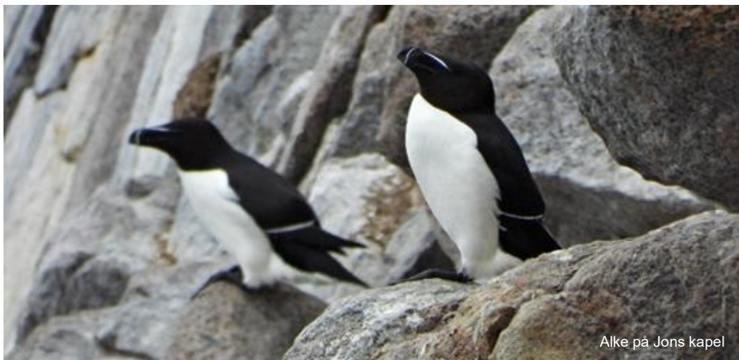
Alke på Jons kapel

her var highlightsene fra turen, så jeg afslutter med nogle billeder fra Bornholm af det der gav de bedste indtryk. Og er I på Bornholm, så skal I prøve Svaneker røgeris røget laks og frikadeller. De er gode.