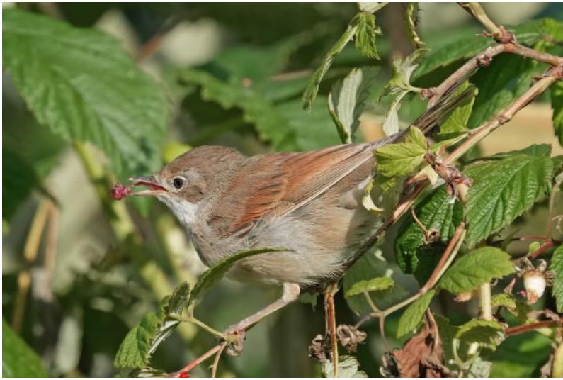
Tornsanger supplerer kosten med frugt

rene sidder på buskene til langt hen i efteråret, må de være til stor nytte for flere af droslerne, når de kommer på træk fra de nordlige egne.