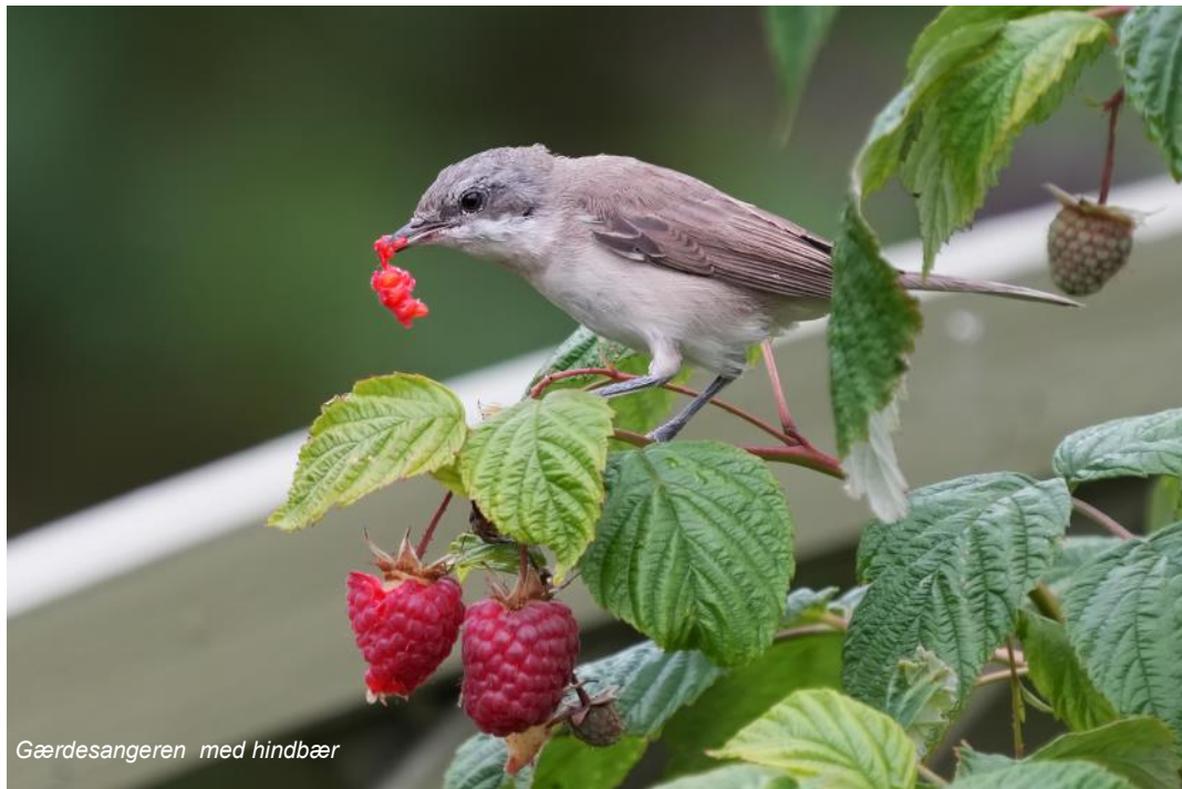
Gærdesangeren med hindbær

i hindbær-bedet, men de rørte aldrig bærrerne. Unge Musvitter og Blåmejser prøvede en gang imellem at spise bær, men det var åbenbart ikke en livret.