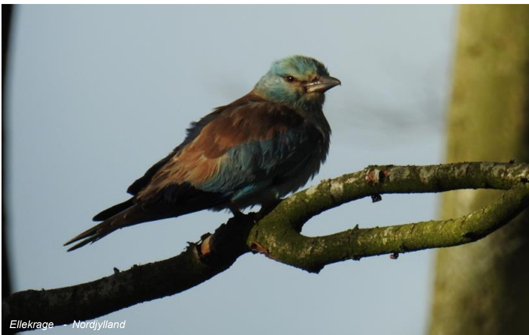
Ellekrage – Nordjylland

At holde øje med de daglige indberetninger i DOF-basen i specielt Sønderjylland blev en lille besættelse. Hvor ses de gode fugle, på hvilken lokalitet og er der måske endda afsat et positionssted for observationen. Er det mon en "morgen-obs.", eller måske en træk-observation. Man kan udlede meget af at nærstudere DOF-basen. Og det er et super redskab til at planlægge den næste fugletur.