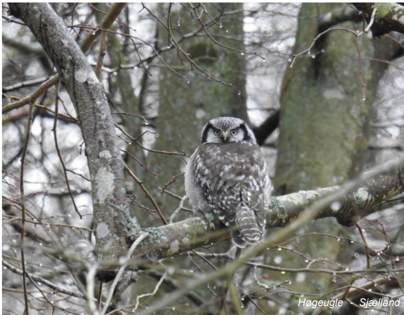
Høgeugle - Sjælland

Og kan man ikke rigtig finde fuglepositionen ud fra udmeldingen, kan man ofte blot se efter en samling parkerede biler. Her vil man ofte finde disse "60-årige gamle mænd med kikkert uden særlig god høresans".