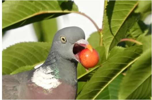
Ringduer kan også lide kirsebærrene

Jordbær. Ja, Solsorten kommer tidligt på besøg og tager selv ikke helt modne bær. Vi lægger tidligt et net over bedet, så vi selv kan få glæde af høsten. Derved kan vi holde Solsortene ude, men det virker ikke mod dræbersneglene. I flere år har vi ærgret os over at se sneglene ligge og suge saften ud af store, modne jordbær. Men i år var der næsten ingen dræbersnegle i haven, vel sagtens som følge af den tørre periode i maj-juni. Vi bruger vilde jordbær (skovjordbær) som bunddække flere steder i haven. Det ser