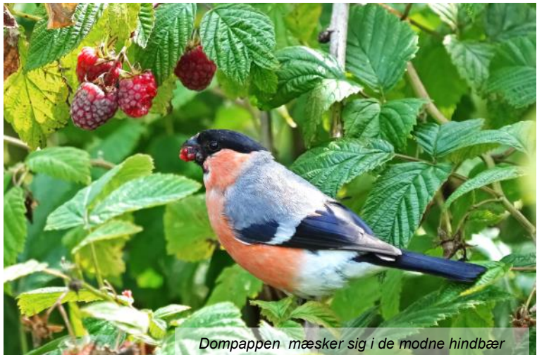
Dompappen mæsker sig i de modne hindbær

Hindbær. Både Solsort og Dompap kan godt gå på rov på modne hindbær. Det kan de tre Sylvia -sangere også, nemlig Gærdesanger, Tornsanger og Munk. Især Gærdesangerne kom dagligt på besøg og tog for sig af de modne bær. De to almindelige Phylloscopus -sangere, Gransanger og Løvsanger, kom også hyppigt på besøg