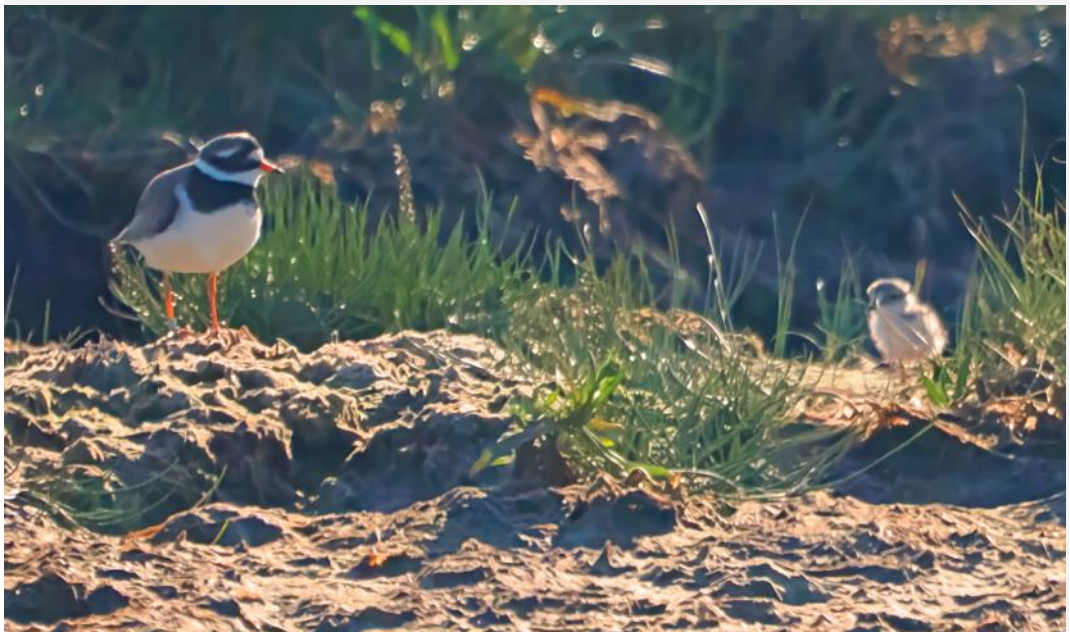
Stolt far med sin unge

gig@museumstavanger.no blev gåden løst, idet man i Norge havde et gæt på, at fuglen var blevet ringmærket i Baskerlandet i Spanien! Vores observationsdata blev umiddelbart videresendt fra Norge. Få timer efter indløb information fra Urdalbar Bird Center i San Sebastian (Aranzadi), at fuglen var fanget i net i Busturia (San Kristobal) den 30.8.2022 som 1k og ringmærket med VX 08205. Med rapporten i hånden kunne vi notere,