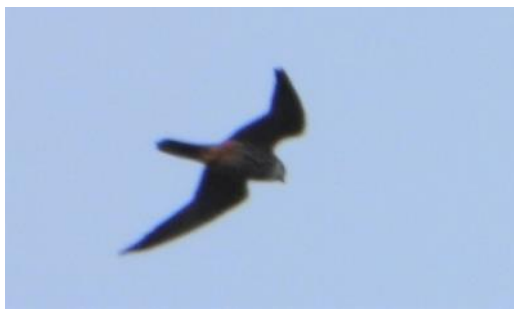
Lærkefalk ved sommerhuset

ikke til at miskende munkens sang lige for tiden, for jeg har da aldrig hørt så mange munke som på Bornholm. Der var ikke en busk, en skov eller krat, hvor der ikke sad sådan en og sang dagen igennem. Dens sang er dog noget mere rar at høre på end spættens.