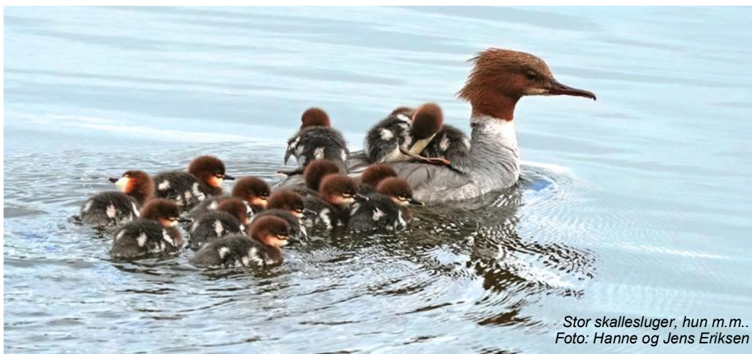
Stor skallesluger, hun m.m..

mer forbi os stille og roligt i en meters afstand. Det samme skete i går morges – heldigvis stadig med 5 ællinger. Jeg skriver heldigvis , fordi vi for ca. 10 år siden havde samme oplevelse: Skalleslugerhunnen svømmede forbi os med - talte vi -18 unger. Den gang var redekassen ved indgangen til Sønderskoven / Strandstien beboet. Vi frygtede det værste for de mange små unger fordi kragerne kredsede rundt omkring dem. Næste morgen var der ingen skalleslugerfamilie i bugten, - jeg opholdt mig dernæst længe ved redekassen - og var derved vidne til, at hunnen blev jagtet af krager og søgte ind i /tilbage til redekassen med sit "krookrrråå".